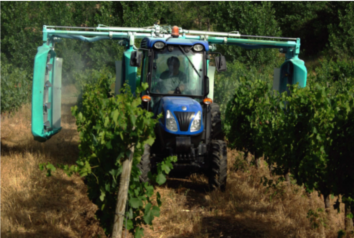
Figure 1: Pulvérisateur à panneaux récupérateurs Dhugues Koléos