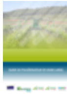
Figure 3: Guide choix pulvérisateur