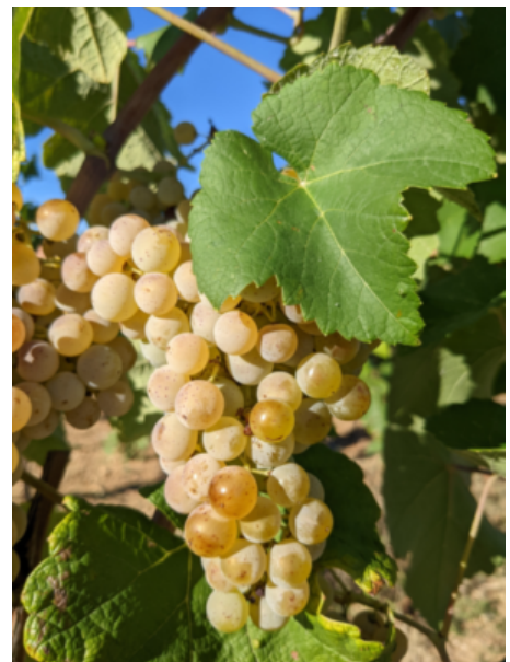
Figure 1: Grappe de Floréal à maturité, réseau OSCAR

L'obtention d'une variété résistante vis-à-vis d'un pathogène est le résultat d'un long processus de plusieurs cycles d'hybridation afin d'insérer les caractères de résistance des vignes américaines et asiatiques dans le fond génétique des vignes européennes. L'objectif est de mêler résistances aux pathogènes et qualités organoleptiques et gustatives. La plantation de variétés résistantes à certaines maladies cryptogamiques (mildiou et oidium) permet de réduire significativement l'utilisation de produits phytosanitaires.