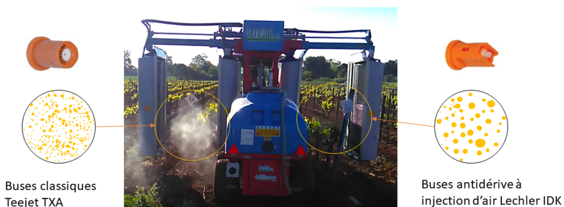
Figure 1: Pulvérisateur équipé à gauche de buses classiques et à droite de buses antidérive

On distingue les buses classiques des buses à injection d'air, dites antidérive . Les buses à injection d'air (IDK90° Lechler, CVI80° Albus) génèrent des tailles de gouttes supérieures à celles obtenues avec des buses classiques. Les gouttes étant moins fines, elles sont moins sensibles à la dérive.